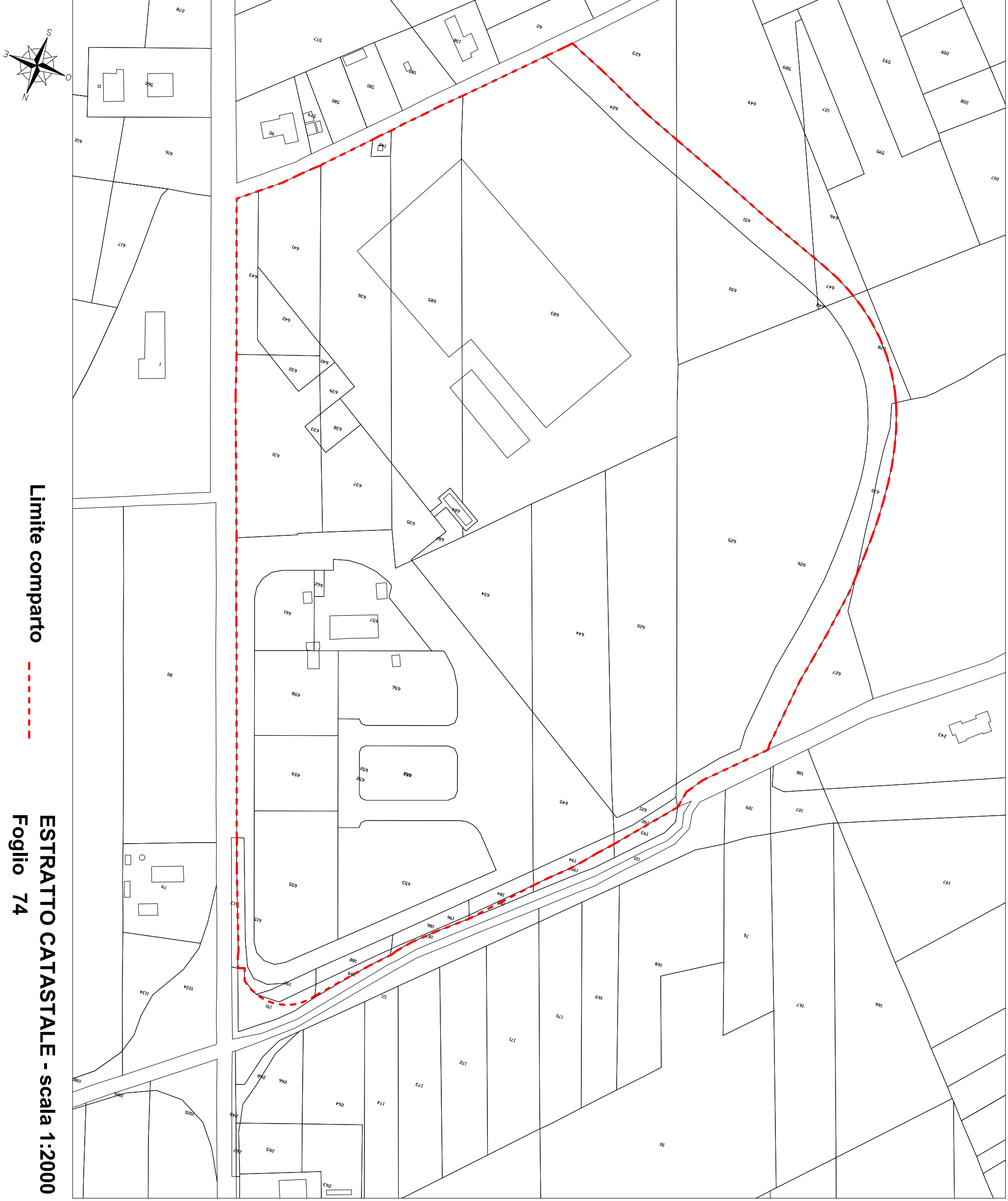
Limite comparto Estratto Catastale - scala 1:2000 Foglio 74