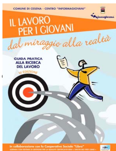
Guida al Lavoro Copertina VI edizione (anno 2009)

All'Informagiovani del Comune di Cesena stiamo lavorando per aggiornare e migliorare la Guida.