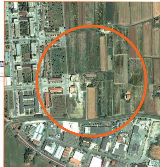
Planimetria di progetto