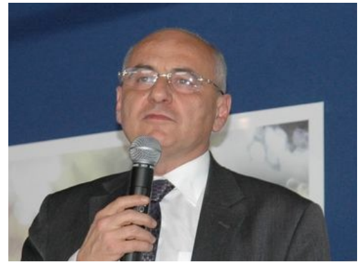
Marc Daunis Senatore e Sindaco di Valbonne Sophia Antipolis,Francia

sostenuto dalla Comunità Sophia Antipolis Agglomeration (CASA). daunis ha inoltre sottolineato che: "Per consolidare il tecnopolo, le parti interessate hanno preferito optare per azioni strategiche basate su due concetti; concorrenza e cooperazione". Il parco tecnico raggruppa 7 poli di competitività, 2 incubatori, 8 laboratori di ricerca pubblici con 500 dottorati di ricerca (PHD) e 2 scuole aziendali. "Trattandosi di un progetto pilota, il campus STIC accoglierà oltre 5000 studenti, offrendo non solo un talento incomparabile, ma anche un approccio collaborativo alla ricerca, unendo e rafforzando i centri di eccellenza situati a Sophia Antipolis ", ha aggiunto. Le buone pratiche di Ermis dell'Istituto direttamente dall'Incubatore Pedro Nuñez, saranno studiate dalla Comunità Sophia Antipolis Agglomeration, in vista di una integrazione e rafforzamento della tecnopoli di Sophia Antipolis.