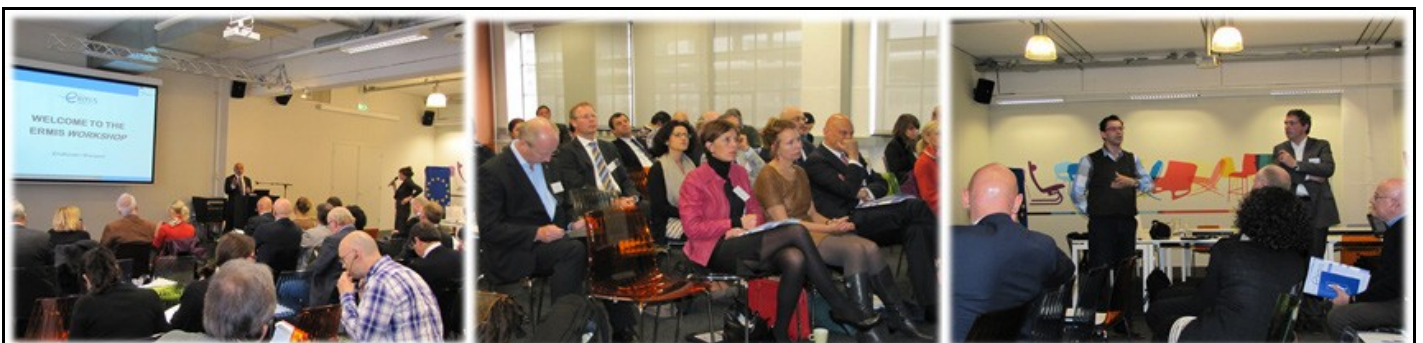
ERMIS Interregional Innovation Workshop, 4 aprile 2012, Eindhoven, Paesi Bassi

Il seminario ha presentato esempi e di buone pratiche per un'efficace intervento pubblico in merito a questi tre temi, ma ha anche contestato le pratiche attuali dando modo di riflettere su come i governi possano giocare ruoli più efficaci nel favorire l'innovazione