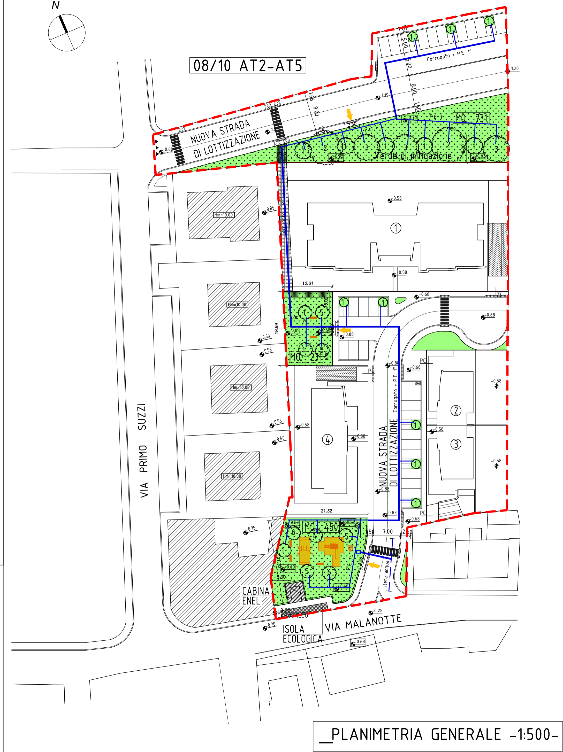
_PLANIMETRIA GENERALE -1:500-

Tavola Planimetria verde pubblico 9 Data Novembre 2010 Scala metrica 1 : 500 P. 11 / 1614 Licenza d'uso: Autocad LT 2005 342-49487796 - Autocad LT 2002 640-00970344