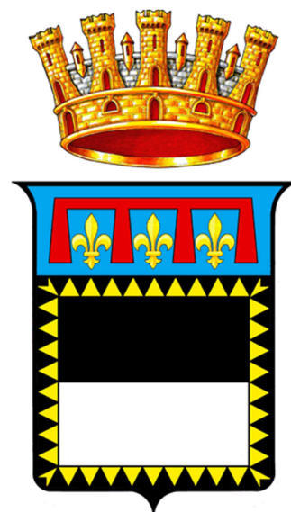
Figura 1 - Stemma del Comune di Cesena

Cerchiamo di fare luce su questi aspetti, partendo dai dati di fatto.