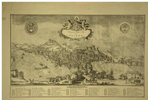
Figura 8 - Il celebre rame con il "Prospetto della Città di Cesena" del Sassi (1775), in cui compaiono sia - a sinistra - lo stemma moderno che - a destra - quello ritenuto il più antico.

Si giunge, poi, all'Ottocento, allorché si torna alla bipartizione equa nero-argentea, con il capo angioino di uguale dimensione e corredato nuovamente sia da lambello che da gigli.