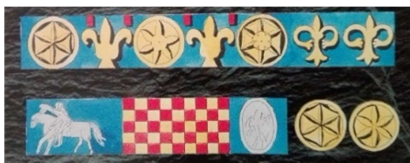
Figura 2 - Rielaborazione degli stemmi presenti sulla "porta magna" del Palazzo del Podestà di Rimini. Si notino la rosa, la bandiera a scacchi rossi e oro e i gigli angioini, i quali potrebbero ricondursi allo stemma di Cesena.