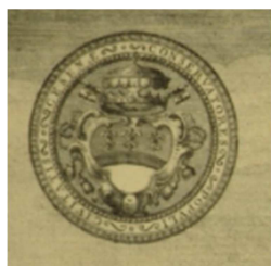
Figura 9 - Stemma alla maniera di fine '700, nella foggia presente anche sulla mazza da parata di Pio VI custodita in Malatestiana.

Nel corso del Settecento, la pezza di nero diviene semplice fascia mediana, sempre più sottile, mentre la forma dello stemma assume forme anche bizzarre, inclini al gusto del momento; compaiono le armi papali di concessione (l'ombrello o “basilica”, e le due chiavi), mentre Cesena diventa la “Città dei Tre Papi”.