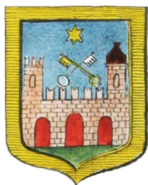
Figura 3 – Antico stemma di Cesena come riprodotto nel “Blasone cesenate” del 1798.

Secondo varie fonti il più antico stemma di Cesena di cui si abbia notizia doveva avere la forma di un castello con due torri, in campo azzurro, con stella in oro e chiavi di S. Pietro. Con ogni probabilità dovette essere l’emblema della città fino alla metà del XIII secolo, quando intercorsero le vicende storiche che portarono poi allo stemma attuale. Sue raffigurazioni si ritrovano nel celebre rame “Prospetto della Città di Cesena” di Sebastiano Sassi (1775) e nel “Blasone cesenate...” di Gioacchino Sassi (1798).